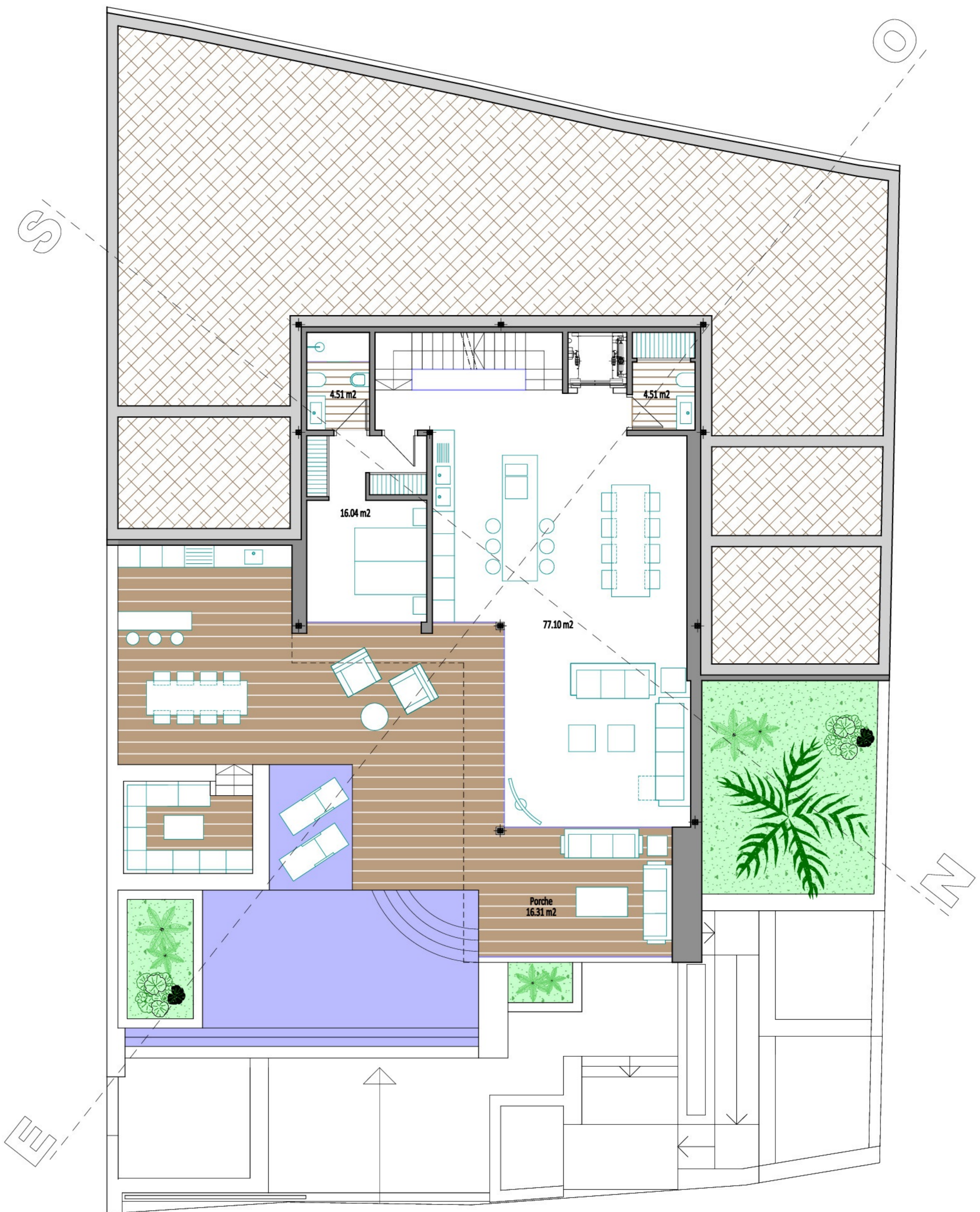
Cuadro de Superficies